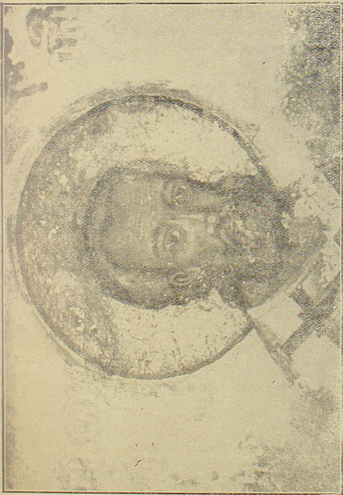
СВ. САВА, фреска из Испоснице манастира Студенице. (в. Народна Сѣarina број 11.)

дом Господњи да подигне постави крст да се на сваком месту име Божје прослави. Беху то мале